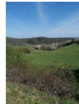
Blick auf Knollsberg und Körle