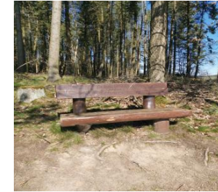
Ruhebank mit herrlicher Fernsicht