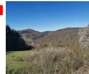
Blick von der „Seire“ zur Sackpfeife