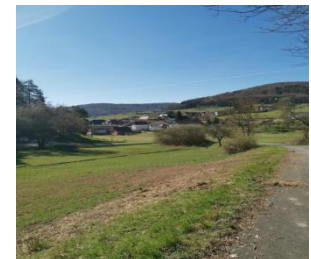
Blick auf Dexbach